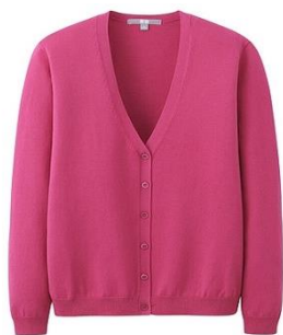
ピンクのカーディガン※1(ユニクロ)