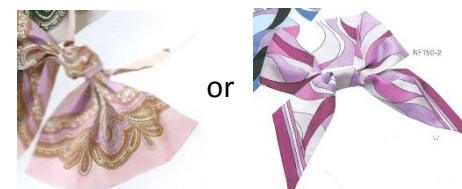
ピンクのリボン(2候補の内どちらか)

※選定アイテムはオールシーズン対応。(但し春・夏は半袖のシャツ、秋冬は毛カーディガンを別途追加用意)