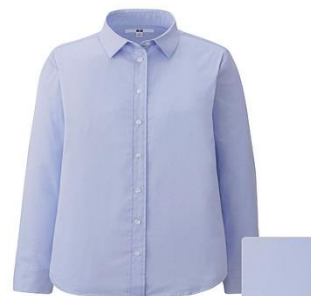
ブルーのシャツ(ユニクロ)